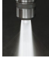
端面噴灑出水 冷卻液